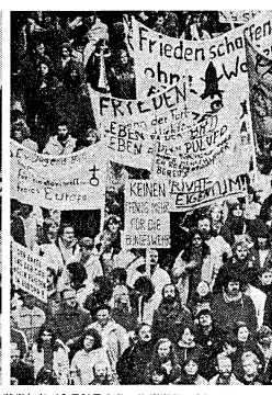
原爆ドームの前で「グレイ・イン」する若者たち(3月21日広島一共同通信・左)と盛り上がる市民の反核運動(右)