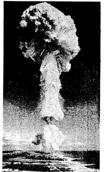
フランスの核実験により生じたキノコ雲