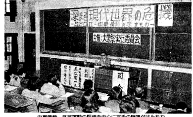
中東博覧、反核運動の発展を中心に三氏の講演がはげられた 写真は前掲第一頁 10月31日 北1-21教室

中央企画「深まる現代世界の危機」 「反核運動」への疑問を提示 十一月十日、北一〇二教室に於て、中央企画「深まる現代世界の危機」の講演会が、中東博覧、反核運動の発展を中心に三氏の講演がはげられた。