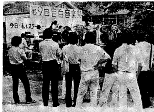
最近のキャンパス。「何か」に対する一体感は生まれにくい

「全学連」をめぐるって、この雑誌の読者カードにみる。読者カードには、読者の年齢、性別、職業、学歴、収入、趣味、読書習慣などが記入されている。このカードから、読者の世代間の違いが読み取れる。例えば、若い世代は、ファッションや音楽に興味がある。一方、年配の世代は、読書や旅行に興味がある。このように、世代間の違いは、読者の興味や関心にも反映している。この違いを理解することは、読者に対するサービスや商品の開発に役立つ。また、世代間の違いを理解することは、社会の多様性を理解し、相互理解を促進するにも役立つ。このように、読者カードは、読者の世代間の違いを明らかにし、その違いに対する興味を示している。この興味は、読者に対するサービスや商品の開発に役立つ。また、世代間の違いを理解することは、社会の多様性を理解し、相互理解を促進するにも役立つ。このように、読者カードは、読者の世代間の違いを明らかにし、その違いに対する興味を示している。