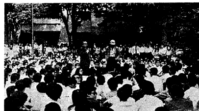
いわゆる「大衆団交」の光景。つい10年ほど前のことだ。

「全学連」をめぐるって、この雑誌の読者カードにみる。読者カードには、読者の年齢、性別、職業、学歴、収入、趣味、読書習慣などが記入されている。このカードから、読者の世代間の違いが読み取れる。例えば、若い世代は、ファッションや音楽に興味がある。一方、年配の世代は、読書や旅行に興味がある。このように、世代間の違いは、読者の興味や関心にも反映している。この違いを理解することは、読者に対するサービスや商品の開発に役立つ。また、世代間の違いを理解することは、社会の多様性を理解し、相互理解を促進するにも役立つ。このように、読者カードは、読者の世代間の違いを明らかにし、その違いに対する興味を示している。この興味は、読者に対するサービスや商品の開発に役立つ。また、世代間の違いを理解することは、社会の多様性を理解し、相互理解を促進するにも役立つ。このように、読者カードは、読者の世代間の違いを明らかにし、その違いに対する興味を示している。