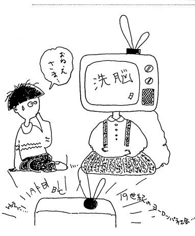
放送大学だからコウナッタ!?

放送大学は、教育の機会均等を宣言し、人工衛星により全国45万人をカバーする。これは、従来の大学教育では実現できなかった大規模な教育ネットワークの構築を意味している。また、放送大学は、社会人教育にも力を入れており、働きながら学ぶことができるという大きなメリットがある。