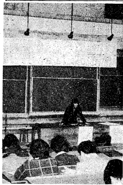
四月二十五日午後、国文科演習室で演習を受ける学生たち。前列は、演習希望者があふれる様子。

本学が今年度から実施している「水増し入学」の弊害が具現化している。国文科では演習希望者があふれるなど、教育環境の充実が望まれる。また、時間割リの変更も110件、時限の変更も8件に達している。これは、水増し入学による学生数の増加が原因と見られる。