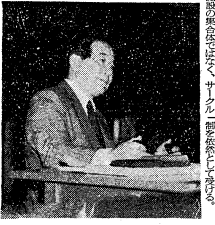
少連協の機関に答える門生協学生部長