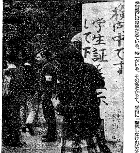
昨年6月、内ゲバ(後)された後門農道も来るとし、用心深い大学には今日も警察がその辺に...