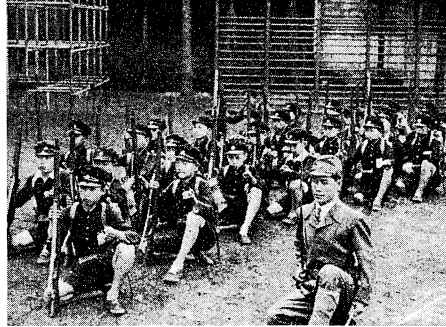
1947年には小学校でも愛国教育が行われたが、現代の教育は再びこの道を出ようとしている

戦後教育の転換は、戦前教育からの大きな変化である。戦前教育は、愛国心を育て、奉仕の精神を重視する教育であった。戦後教育は、民主主義教育の進展とともに、愛国心を育て、奉仕の精神を重視する教育から、民主主義教育の進展とともに、愛国心を育て、奉仕の精神を重視する教育へと転換した。 しかし、近年は、国際情勢の激変や、国内の社会問題の深刻化などにより、愛国心を育て、奉仕の精神を重視する動きが再び盛んになっている。特に、初・中等教育において、愛国心を育て、奉仕の精神を重視する動きが顕著である。