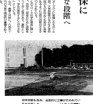
日本郵政も含み、全面的に工事が行われている北一グラウンド (9月3日撮影)