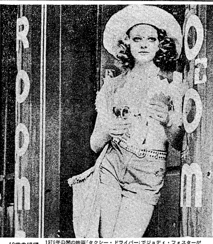
13歳の結婚 1976年公開の映画「タクシー・ドライバー」でジョディ・フォスターが13歳の結婚を演じた大評判になった