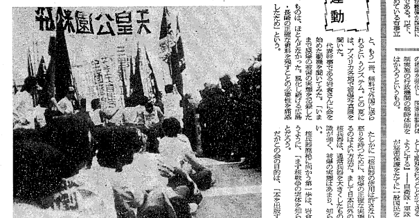
天皇即位五十周年記念公園の建設に反対する立川反戦連合(77・9・2)

有事「国内治安体制の確立めざす」の目的は、国内治安体制の確立にある。この法案は、有事「国内治安体制の確立めざす」の延長線上に、極秘に進む法案研究が行われている。研究内容骨子として、非労働争議法、徴用・徴兵、労働争議の抑制、労働記録簿などが挙げられている。立川反米学生連合は、抑圧のない平和めざして、運動はばむ無関心の壁を乗り越え、地域に結びついた形態へと発展させていくことを目指している。また、たがいの市町村連携をすすめることも重要な課題となっている。