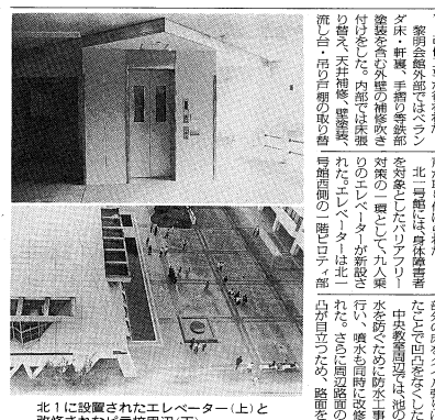
北1に設置されたエレベーター(上)と 改装された北1校庭(下)

「山手線沿線私立大学 コンソーシアム」スタート 青山学院大学、法政大学、国学院大学、明治学院大学、立教大学の5校が、山手線沿線私立大学コンソーシアムを結成し、協定に参加している図書館の一覧を掲載した。この協定は、山手線沿線私立大学コンソーシアムが、各大学の図書館蔵書を相互に活用し、学生がより充実した学習環境を享受できるようにすることを目的としている。また、各大学の図書館蔵書について、相互に活用し、学生がより充実した学習環境を享受できるようにすることを目的としている。