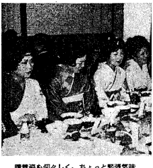
晴着も美しく、ちょっと緊張気味

謝恩会がファッションショーに変わっている。これは、学生たちの競争心を晴着にけるという現象を示している。学生たちは、謝恩会という本来の目的を失い、ファッションショーのようなイベントに変わっている。