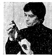
復讐を誓った男の魂の炎は燃えつきるはずはなかったのだが……

「ピックガン」は、最近の学生映画界に吹き寄せられた新しい潮流の代表作として、注目を浴びている。この映画は、学生映画界の新しい潮流を象徴する作品として、注目を浴びている。