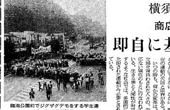
臨海公園前でデジカデモをする学生達 (10・5 朝日新聞)

商店街の声を探る。即自に基づかない対自。横須賀の街並みや人々の生活ぶりを詳しく紹介している。商店街の賑わいや、人々の笑顔が印象的だ。横須賀の街並みや人々の生活ぶりを詳しく紹介している。