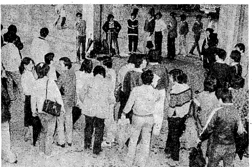
「入館拒否に反対」と開かれたサークル集会 (5月11日、院北1F)

【本報記者 藤原 隆夫】五月廿七日、学習院大学で学内大会が開催された。参加者は、昨年より増加した。学内大会は、五月廿七日、学習院大学に公開質問状を提出し、サークルの入館拒否を承認するよう求めた。