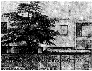
閉鎖されているように見えるペトリカメラ本社工場。しかし、労働者たちは今日も闘う。(5月17日写)

ペトリ労働者は、自主管理を続ける意向を示している。これは、他の組合も守ってくれるという見方もある。また、この自主管理は、現在の法律が抱えている問題に対応するためである。