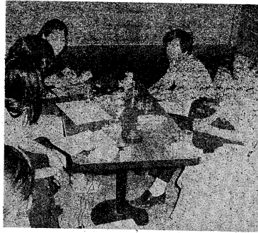
七名の一年生を迎える座談会(5/17)

「少数教育と」といけれど、これは、学生生活の質を向上させるための主体的活動を、学生自身が主導して行っている。これは、学生生活の改善に大きく貢献している。また、学生生活の質を向上させるためには、学生自身が主体的に活動することが不可欠である。今回の論議は、学生生活の改善に大きく貢献している。また、学生生活の質を向上させるためには、学生自身が主体的に活動することが不可欠である。