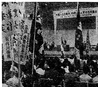
労働者、市民などによる刑訴法改悪阻止集会 (5月12日、日比谷音楽堂)

法務省は、迅速裁判の必要性を説き、裁判所の再編を推進している。これは、現在の裁判所が抱えている案件の増加に対応するためである。また、この再編は、刑法への波及をねらっているという見方もある。