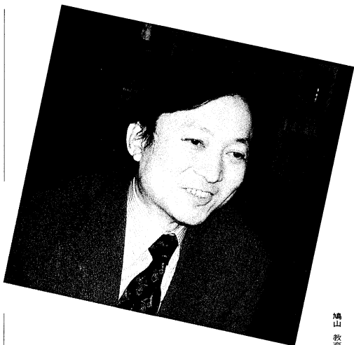
鳩山由紀夫 プロフィール

1947年2月11日、東京都生まれ。49歳。1969年、東京大学工学部卒業。1976年、スタンフォード大学工学部博士課程修了。東京工業大学経営工学科助手、専修大学経営学部助手を経て、1986年、衆議院議員に北海道4区から立候補して初当選。現在、3期目。1993年、自民党を離党して新党さきがけ結党に参加。同年、細川内閣で内閣官房副長官を務め、現在新党さきがけ代表幹事。祖父・一郎氏は元首相、父、威一郎氏は元文相、新進党の鳩山邦夫氏は実弟。