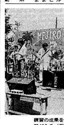
観客の成果も十分に発揮され、演奏にも熱が入る(豊島山荘ステージ)

第10回目音楽祭 真昼の祭典、第10回目音楽祭が開催された。多くの学生が参加し、盛り上がる中、音楽祭の成果も十分に発揮された。