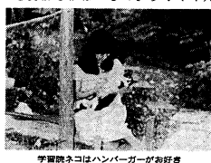
学習院ネコはハンバーガーが大好き

第1回 連載 学習院大学新聞社が主催する「学習院 FOCUS」の第1回連載。内容は、学習院大学の最新情報や学生生活に関する記事である。