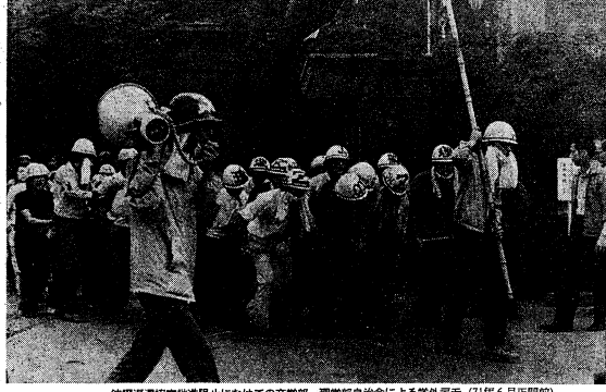
沖野区東部定住地区自治会にむけての文書部、選挙部自治会による学外デモ (71年6月正門前)

多難な歴史過程 本学自治会は、1954年(昭和29年)に設立された。当初は、学生自治の推進と、学生生活の向上を目的として活動していた。しかし、次第に党派闘争の弊害が生じ、一般学生との遊離を招くようになった。