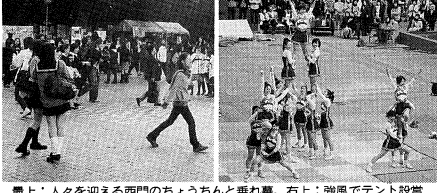
黒上：人々を迎える西門のちようちんと並れ舞、右上：強風でテント設備が倒れ、左上：前夜祭での盛大な総取り、左下：婦人会館前には出店を築きむでであられた、右下：イベントでにぎわった中央教養館の特設ステージ

「11月25日の土曜日の由緒正しく、伝統的祭典である本学祭は、今年も11月25日(月)から27日(水)まで、学習院大学目黒キャンパスで開催された。今年も、学生たちが繰り出す姿が、目黒キャンパスを彩っていた。 本学祭は、天候に恵まれ、初日は、晴れ、2日は、曇り、3日は、雨。祭典は、学生たちが繰り出す姿が、目黒キャンパスを彩っていた。 祭典は、学生たちが繰り出す姿が、目黒キャンパスを彩っていた。