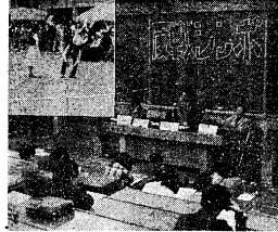
(上)盛衰な壁し、ファウナズ (下)夢知者のまぼろしな反戦シンポジウム