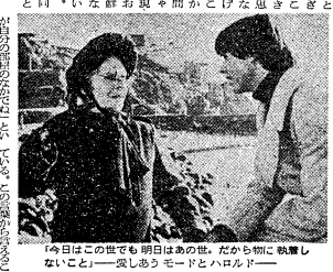
「今日はこの世でも明日はあの世、だから物に執着しないこと」—愛しあひモードとハロルド—

「常識拒否の生き方」とは、英語で「Living Without Conventions」を指す。これは、常識にとらわれず、独自の生き方をするという生き方を指す。例として「individuality」、「creativity」、「freedom」がある。私たちは、常識にとらわれず、自分らしく生きよう。