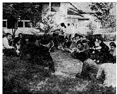
護光会と対峙する学生たち (昨、11月1日)

11・2 叛旗阻止共闘、右翼と乱闘 大学祭の波瀾が収まらず、11月2日夕方、学生自治会本部と護光会との衝突が再び発生し、大規模な騒ぎとなった。この騒ぎは、護光会がポルノ上映の中止を要求し、学生自治会本部がこれを拒否したことに起因している。騒ぎは、護光会による暴力介入の阻止を目的とした学生たちの反撃行動へと発展し、最終的に両団体の間に緊張感が高まっている。 11月2日の夜、学生自治会本部の本部前庭で、護光会メンバーと学生自治会本部メンバーとの衝突が発生した。護光会側は、ポルノ上映の中止を要求し、学生自治会本部側はこれを拒否した。この結果、護光会側が学生自治会本部の本部を襲撃し、学生自治会本部のメンバーを攻撃した。この騒ぎは、学生自治会本部の本部前で、学生自治会本部と護光会との衝突が再び発生した。この結果、学生自治会本部と護光会との間に緊張感が高まっている。