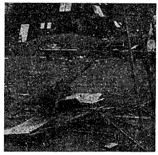
11-2事件の時に破壊された展示物

「学生祭」の準備中。学生祭実行委員会事務局(左)と学生祭実行委員会事務局(右)の職員が、学生祭の準備中。 「学生祭」の準備中。学生祭実行委員会事務局(左)と学生祭実行委員会事務局(右)の職員が、学生祭の準備中。