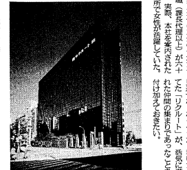
GINZA 8ビル (本社)

株式会社リクルートは、人材紹介や人材育成を行う企業です。また、人材紹介を通じて、人材の流動性を促進し、社会の発展に貢献しています。