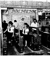
JR駒込駅の自動改札

「学短」学生会館の散歩道は、とても美しいです。緑豊かな環境の中で、静かに過ごすことができます。また、散歩道を通じて、自然の恵みを感じることができます。