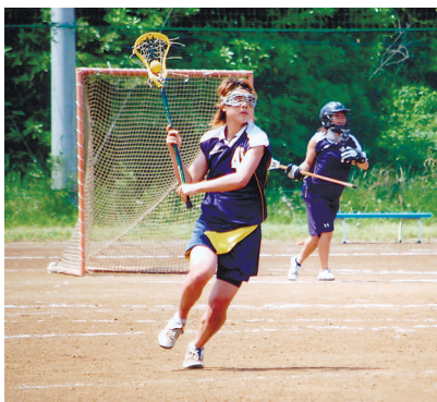
勇猛果敢な攻めを見せる本学選手