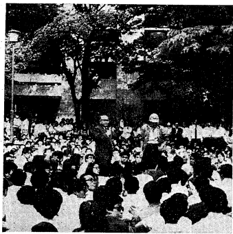
大家団交にこれだけ多くの学生が参加したのは、すでに過去のことになったのだろうか—1989年6月20日、図書館前で

本報記者 藤原 隆 新生自治問題の議論は、ここ数年、学習院大学で最も熱い話題の一つとなっている。その議論の中心には、学生自治会のあり方、その権限の拡大、そして学生生活の質の向上といった課題が挙げられている。 しかし、この議論は単なる理想論や理想論の対決ではなく、現実の学生生活と密接に関わっている。学生自治会が果たすべき役割、その権限の範囲、そしてその運営方法など、多くの疑問が投げかけられている。 この疑問は、単に「自治会は必要か」という問いかけから始まり、さらに「自治会が何をすべきか」という問いかけへと発展している。これは、学生生活の質を向上させるための具体的な手段として、自治会の存在意義を問うているのである。