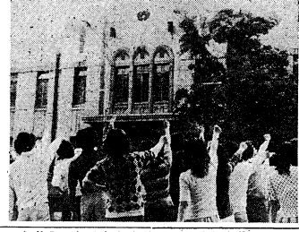
内ゲバ(内ゲバ)の現場。学生らが集まり、抗議活動を行っている様子。

本学でも襲撃事件 当局検問体制ひく 【本報東京20日专電】内ゲバ(内ゲバ)の激化に伴い、本学でも襲撃事件が発生した。当局は検問体制を強化し、学生の安全確保に努めている。また、学生側も自衛のための対策を講じている。