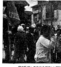
田中私邸への自治会デモ(4月26日)

運動に変化のきざし 【東京17日電】田中私邸へデモが行われ、運動に変化のきざしが見られる。デモ参加者は、田中氏の私生活や政治活動について抗議を行った。