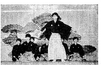
連日、満席で観客を吐く能楽研究会 (写真4-303)

大妻と中央企画のサークル間の連帯について、学生たちはどう考えているのか。学生たちは、大学祭を通じて、自分たちの大学のありさまをアピールし、他の大学との交流を図る。また、学生が自分たちの大学の魅力をアピールし、他の大学との交流を図る絶好の機会である。