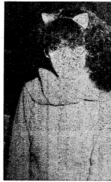
「ネコミミ族」の学生たち。猫の耳を模した仮装をして、キャンパスを徘徊している。

大学祭の夜、キャンパスには、あちこちで「ネコミミ族」の姿が見られる。彼らは、猫の耳を模した仮装をして、キャンパスを徘徊している。彼らは、学生生活の一大イベントであり、多くの学生が楽しみにしている。