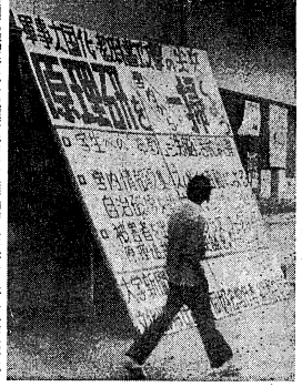
原研の重要性をめぐって、関係者や一般市民の意見を聞き、今後の政策を提言することを目的としている。

原研の重要性をめぐって、関係者や一般市民の意見を聞き、今後の政策を提言することを目的としている。授業前の教室で「原研講義」を行うことで、学生が最新の研究成果や社会情勢について学ぶ機会が増える。また、関係者や一般市民の意見を聞き、今後の政策を提言することを目的としている。