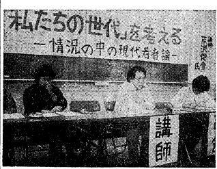
「私たちの世代」を走らせる —情況の中の現代若者論—