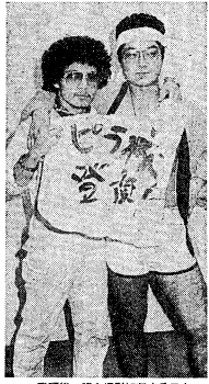
校警頂、記念撮影に収まる二人。無難の生涯では何より。

大学祭の夜、キャンパスには、あちこちで「校警頂」が行われている。これは、学生生活の一大イベントであり、多くの学生が楽しみにしている。