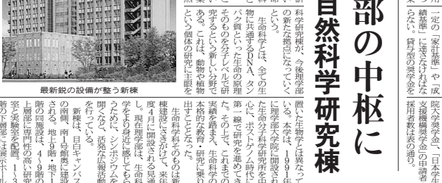
最新鋭の設備が整った新棟

理学部は、自然科学研究棟の新しい棟舎に移転した。この棟舎は、最新の設備が整っており、理学部の研究活動に大きく貢献する。棟舎内には、最新の実験設備や、研究用の図書などが揃っており、理学部の研究活動に大きく貢献する。