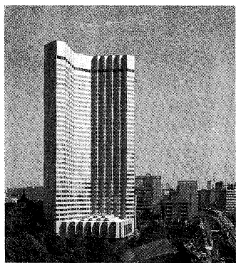
赤坂プリンセスホテル新館

平成二年採用 から始まった。公務制導入以前は、緑蔭、スポーツ関係からの採用が多かったようだが、それを含めた同社二年度採用の採用人数は百二十名程度であった。その中で本学からは男子、女子各三名が採用されている。今年度の採用内定は、次に採用後の配置について