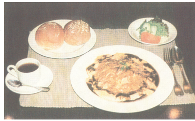
時間帯を問わず、注文できるオムライス