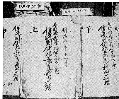
閉鎖された浅科村に「閉鎖」された(五郎兵衛文書)

「歴史は歴史家のものではない」という言葉は、歴史学を専攻する学生にとって、よく聞かされる言葉である。しかし、浅科村の部落解放運動が、歴史を「歴史」家のものから、社会の歴史へと変えようとしている。浅科村の歴史は、部落解放運動の歴史であり、それは、歴史家の歴史とは異なる。浅科村の歴史は、部落解放運動の歴史であり、それは、歴史家の歴史とは異なる。浅科村の歴史は、部落解放運動の歴史であり、それは、歴史家の歴史とは異なる。