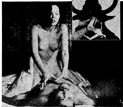
「淫靡罪」として起訴されたステール写真の一枚。単行本「愛のコリーダ」三冊一巻発行。写真より

淫靡罪として起訴されたステール写真の一枚。単行本「愛のコリーダ」三冊一巻発行。写真より