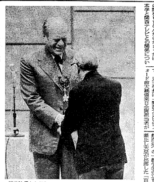
板井院長から学園院長賞状を受け、フットボール大会(3月19日、城記念会館)